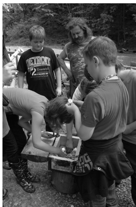
Konečně jsme našli ten poklad.